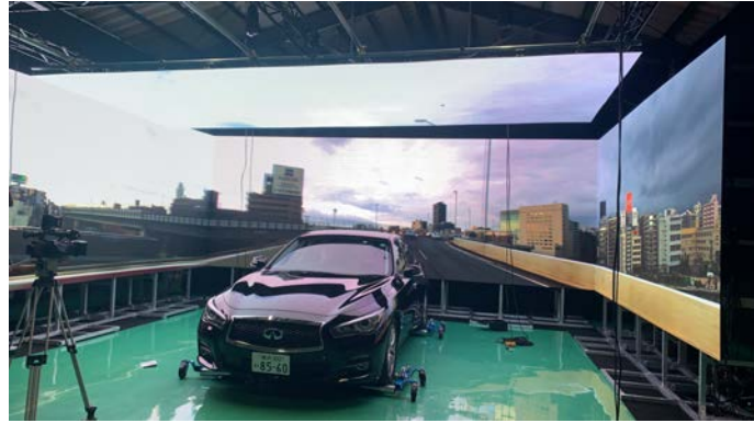
YOKOHAMA CAMP. 内でのLED Screen Process撮影