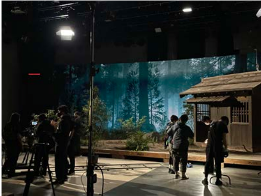
実際にチームで撮影したIn Camera VFX