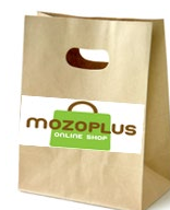
▲mozoPLUS オリジナル包材 （イメージ）

mozoPLUSの大きな特徴の一つに、館内物流の荷捌所との連携があげられます。商品は館内物流を担うワールドサプライ社専属スタッフによってセンターへ集められます。mozoPLUSのオリジナル包材に複数店舗の商品を同梱することでおまとめ配送を可能にし、お客様の複数回受取のストレスを軽減する仕組みを導入しました。