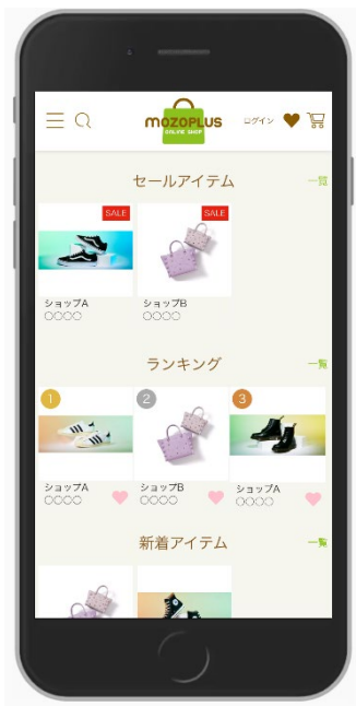
▲スマートフォン画面