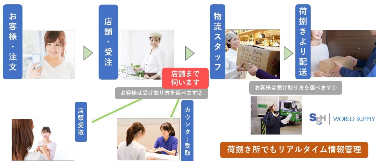
▲mozoPULS・注文からの配送（イメージ）

※カウンター箇所：当施設内 4F に設置予定 対応時間：10：00～18：00 （一部無人対応）