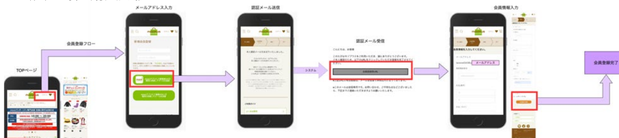
▲mozoPLUS・お客様会員登録の遷移（イメージ）