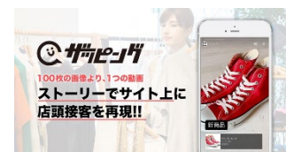
▲動画投稿「ザッピング」

動画投稿のストーリー型オンライン接客ツール「ザッピング」を搭載。専門店スタッフによる動画・ストーリー投稿からの購買を可能にしたほか動画ならではのメリットを活かし、ザッピング動画を SNS へシェアするなど、現代に合わせたスマートフォン仕様になっています。