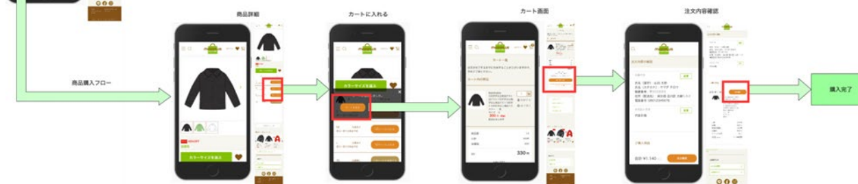
▲mozoPLUS・お客様の注文から購入画面の遷移（イメージ）