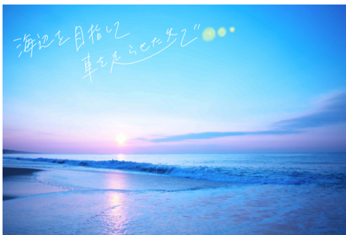
(1) 海のブレンド：海辺を目指して車を走らせた先で

ブレンドは、世界 No.1 バリスタ 粕谷哲さんが監修します。小説は、テーマに合わせてオリジナルで執筆されます。5月限定のコーヒーボックスは、4月末までに新規ご入会の方及び、継続ご利用会員の方限定でお届けいたします。おうち時間を刺激する体験型コンテンツとして、「小説×珈琲」の新しい物語の世界を体験ください。