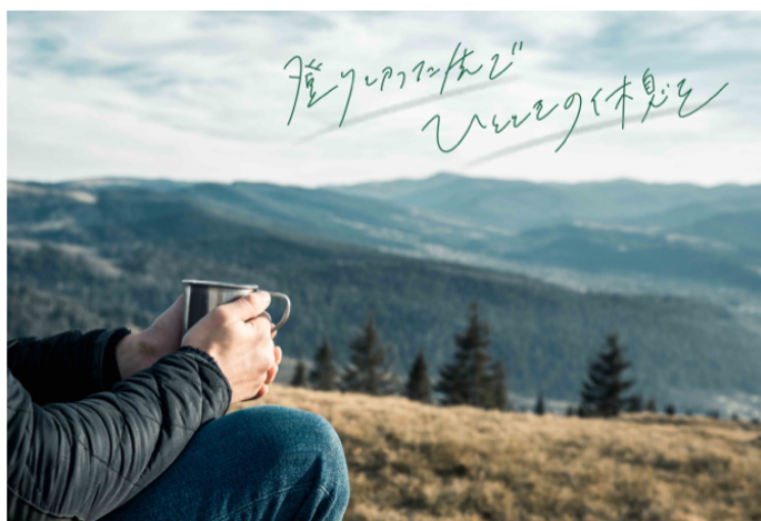
(2) 山のブレンド：登り切った先でひとときの休息を