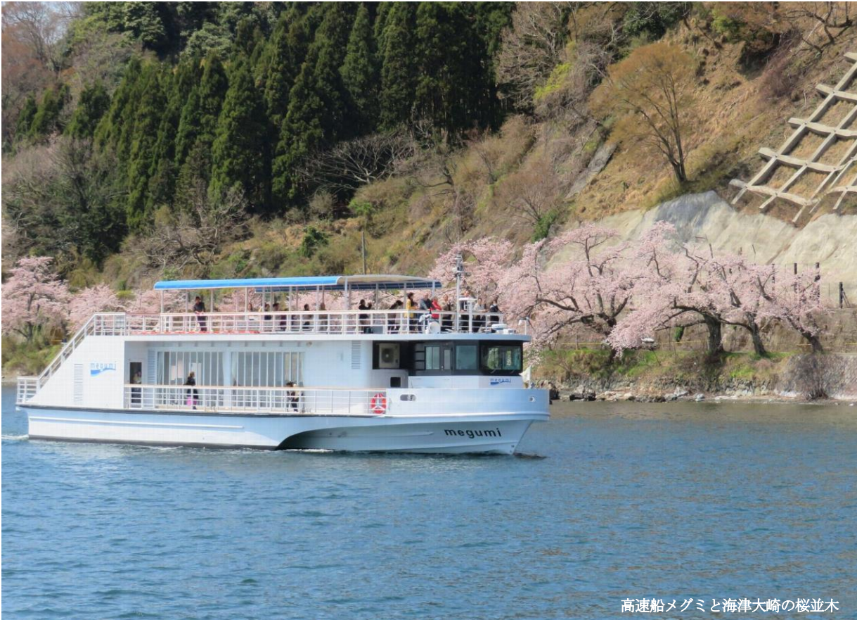
高速船メグミと海津大崎の桜並木