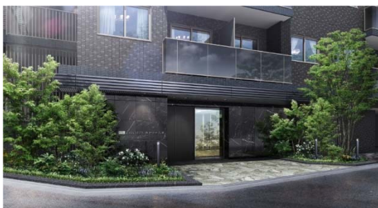
【エントランスイメージ】