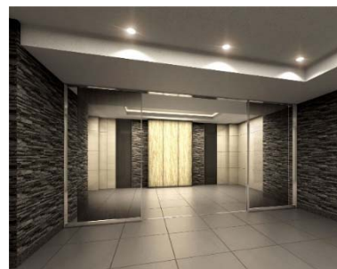
【エントランスホールイメージ】