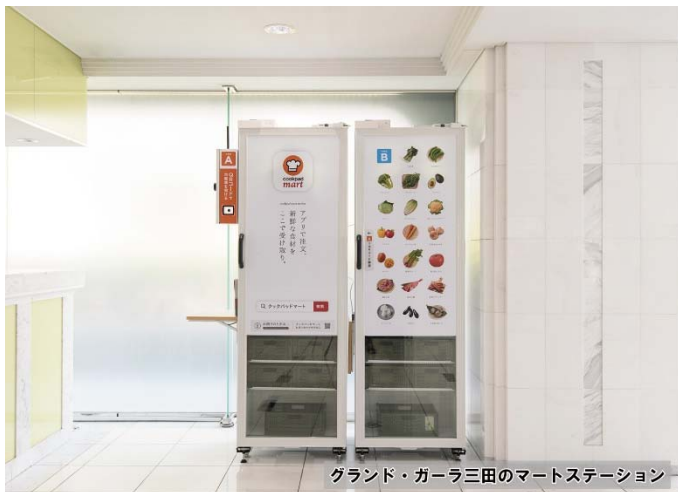
グランド・ガーラ三田のマートステーション