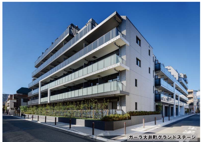
ガーラ大井町グランドステージ