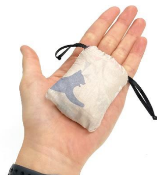
通常レギュラーサイズ「NANO BAG」 「NANO BAG micro」より少し大きい

2020 年 7 月より施行されたレジ袋有料化から約 5 か月がたった今、特にコンビニなどレジ前での手間、面倒な点がエコバッグの大きな課題でした。エートレードが提供するエコバッグ「NANO BAG (ナノバッグ)」は、「手のひらサイズに畳めるので収納が楽」「クシャクシャのままポケットに突っ込めるのでレジ前でバタバタしなくて済む」など、厚さは 0.05 ミリと細い髪の毛程度で嵩張らず、重さが単三電池 1 本程度の 22 グラム、横幅 5 センチ程度と“手のひら”サイズ感が受けて、2019 年 9 月の一般販売から累計販売数 7 万個を突破した商品となりました。「そんなに