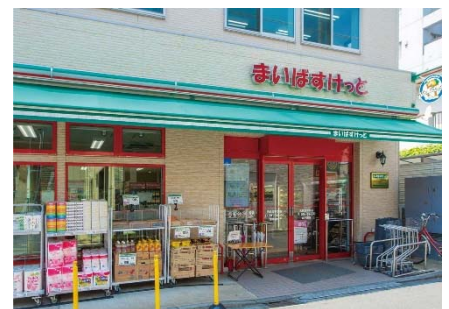
【まいばすけっと井田中ノ町店】