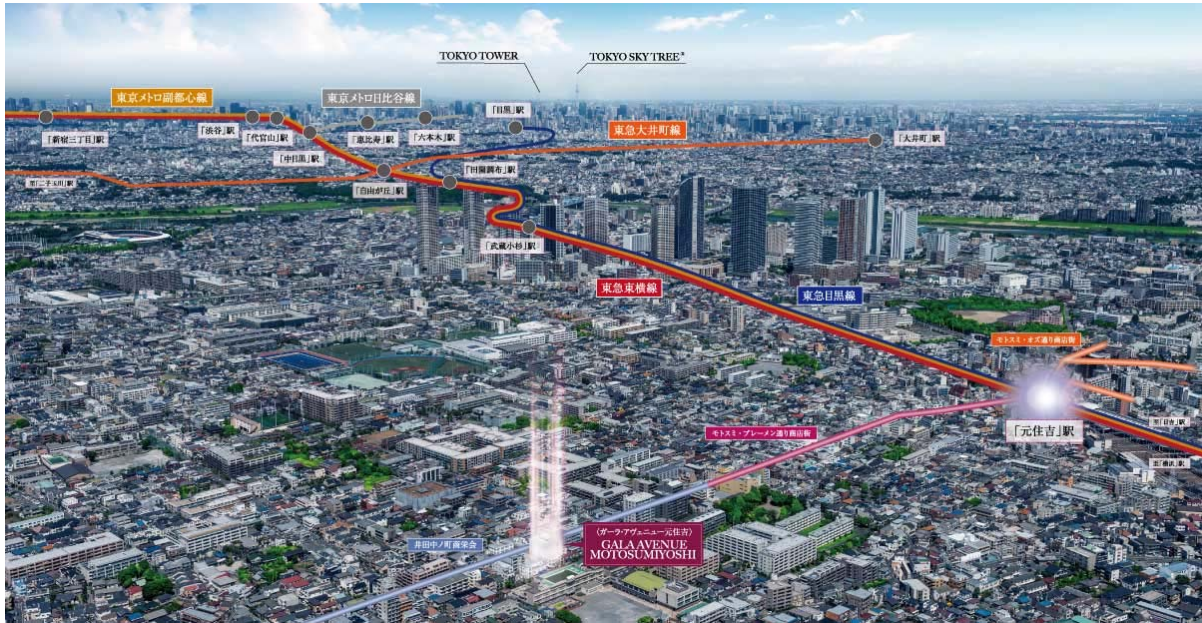
【現地上空からの航空写真】