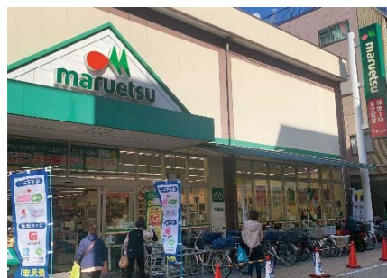
【マルエツ元住吉店】