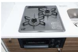
【Siセンサー付き2ロガスコンロ】