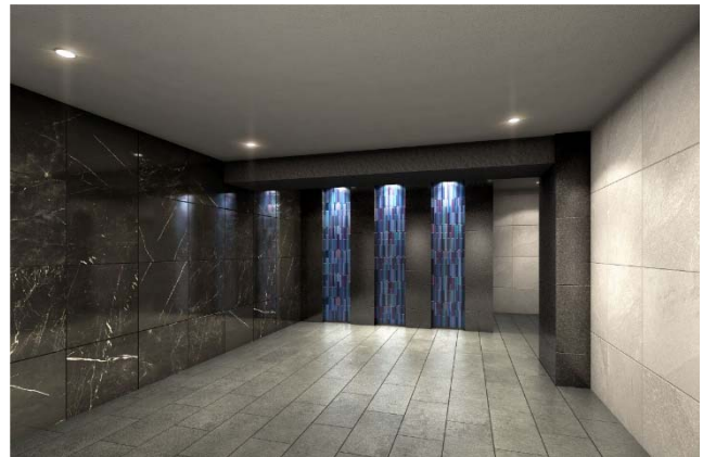
【エントランスホールイメージ】