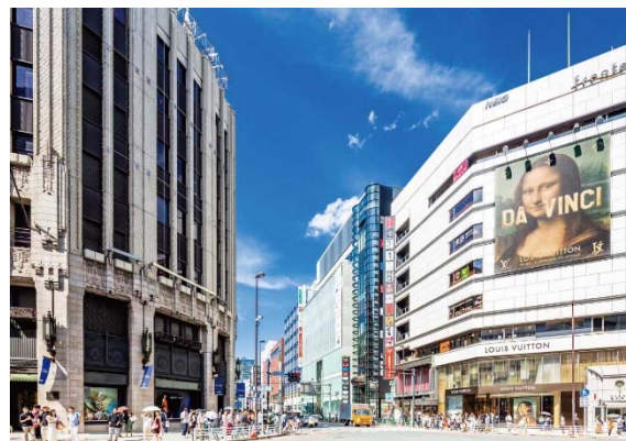
【新宿三丁目交差点】