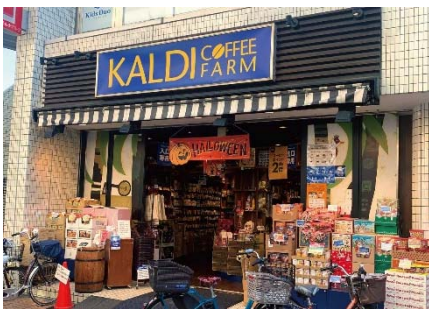
【カルディコーヒーファーム元住吉店】