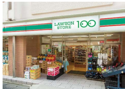
【ローソンストア100川崎元住吉店】