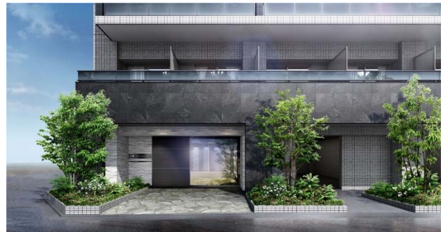
【エントランスイメージ】