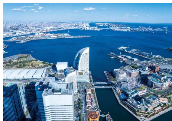
【横浜みなとみらい】