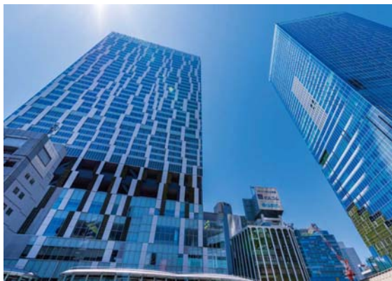
【渋谷ストリーム・渋谷スクランブルスクエア】