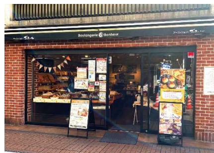
【プーランジェリー・ボヌール元住吉店】