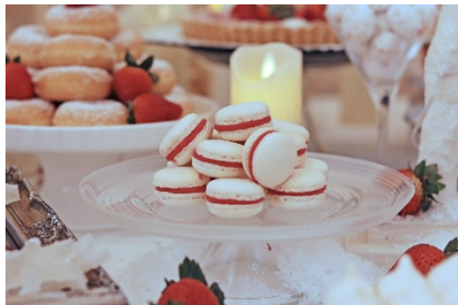
甘酸っぱい真っ赤なクリームを挟んだ苺マカロン