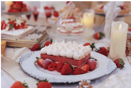
ふわふわの苺ムースとサクサクしたメレンゲとの 絶妙な食感が楽しめるメリンガータ