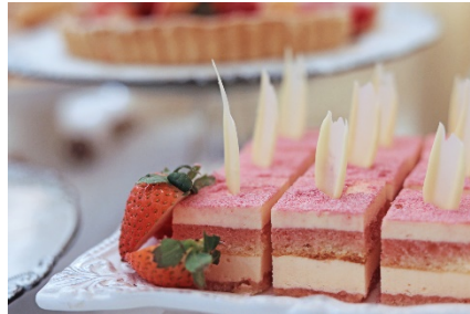
軽い口当たりのティラミス