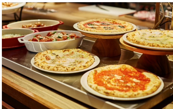
焼きたてのナポリピッツァ