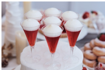
シャンパンに見立てた、苺が優しく香るゼリー