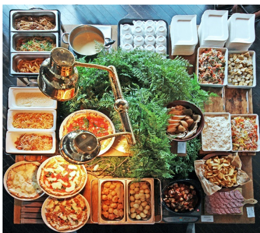
種類豊富なイタリアンの数々

XEX 日本橋では、モチモチの食感が虜になる焼きたてナポリピッツァや、色鮮やかな前菜にパスタなどのイタリアン全40種に加え、スイーツなど目移りするほど種類豊富なランチbuffeを開催しております。その中でも、季節ごとにテーマを変えながらパティシエこだわりのセレクションでお届けしている大人気のストロベリーbuffeが、まるで雪原の中に広がるいちご畑のような世界観を表現した「Snow white strawberry～#東京の中心でいちごを頬張る～」と題してリニューアルいたします。白を基調としたディスプレイやスイーツが、より一層真紅の苺を引き立て目でも舌でも味わえるラインアップとなっております。スイーツは常時20種類ご用意しており、各月限定のメニューも登場します。この冬は、「東京の中心地・日本橋」に当店自慢のイタリアンとともに旬の苺を思う存分頬張りにお越しください。