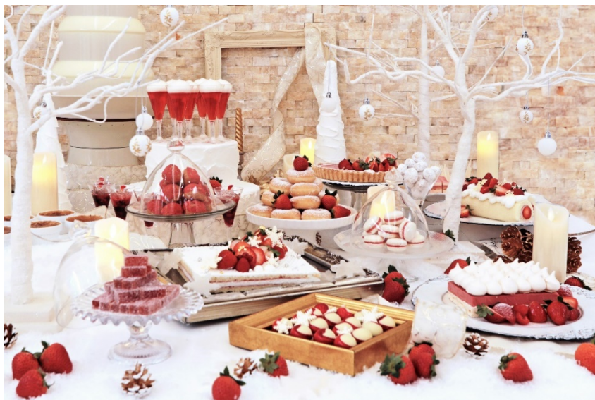
ストロベリーbuffe「Snow white strawberry～#東京の中心でいちごを頬張る～」 イメージ

融合レストラン「XEX (ゼックス)」やイタリアンレストランの「SALVATORE CUOMO (サルヴァトーレ クオモ)」などを手掛ける株式会社ワイズテーブルコーポレーション(代表取締役社長執行役員:船曳 睦雄、本社:東京都港区赤坂)が運営する「XEX 日本橋」では、2020年12月1日(火)から2021年2月末(予定)まで、ストロベリーbuffe『Snow white strawberry～#東京の中心でいちごを頬張る～』を開催いたします。