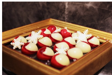
苺とフランボワーズのジャムが入った艶やかな ボンボンショコラ