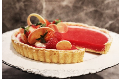
ホワイトチョコをあしらった苺タルト