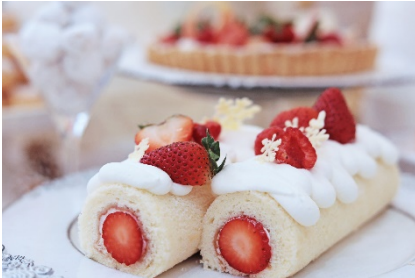
ふわふわスポンジで苺をくるんだロールケーキ