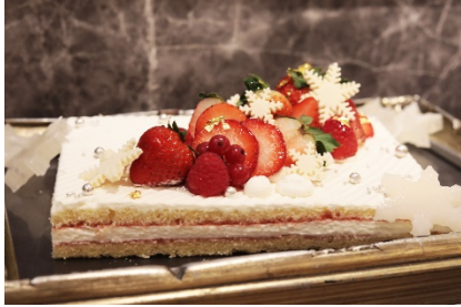
定番人気の苺のショートケーキ