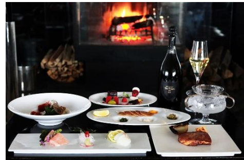
XEXコース(全6品)30,000円(税込・サ別) 贅沢コース(全7品)19,800円(税込・サ別) 提供期間：12月21日(月)～27日(日) 提供時間：17:00～22:00(L.O.)

前菜はオシエトラキャビアでスタートし、お造りの盛合せ、伊勢海老と鯛のトリュフクリームスープ、メインはシャトーブリアンと神戸牛の食べ比べを堪能できる「XEXコース」。煌びやかな前菜5種盛り、フォアグラのソテー、バーニャカウダ、伊勢海老と鮑のソテー、メインは特選和牛ステーキを愉しめる「贅沢コース」。お好きなコースで至福のひと時をお過ごしください。