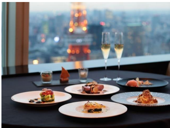
XEX ATAGO GREEN HILLS / Salvatore Cuomo Bros.