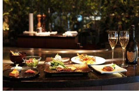
クリスマスコース(全7品) 20,000円 (税サ込) 提供期間：12月23日(水)～25日(金) 提供時間：17:00～22:15(L.O.)

鮭のパイ包み焼きや和牛の握りなど趣向を凝らした前菜3点盛り、スープ、オレンジソースが爽やかな味わいのフォアグラのソテー。目の前で豪快に焼き上げる伊勢海老の鉄板焼きに続き、メインの黒毛和牛ステーキはサーロイン、フィレ、シャトーブリアンからお選びいただけます。最後はガーリックライスと伊勢海老の頭殻でとった出汁のお味噌汁で余すことなくお楽しみください。