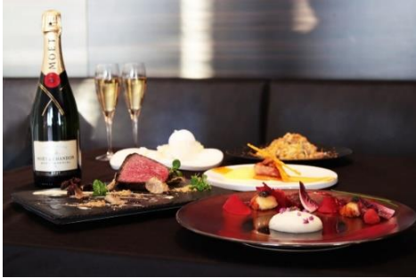
クリスマスコース(全6品) 15,000円 (税サ込・テーブルチャージ別) 提供期間：12月23日(水)～25日(金) 提供時間：17:00～22:00(L.O.)

東京駅を眼下に聖夜を彩るクリスマスコース。前菜はオマール海老と本マグロのセミクルードにキャビアを添えて。帆立貝に濃厚な雲丹のソースを合わせた前菜に続き、比内地鶏の Pasta、しっとり焼き上げた鹿児島県産尾長鯛、トリュフの芳醇な香りが堪らない黒毛和牛フィレ肉の葉包み焼き。デザートは純米酒景虎を使った白銀世界をイメージして仕上げたパンナコッタを。