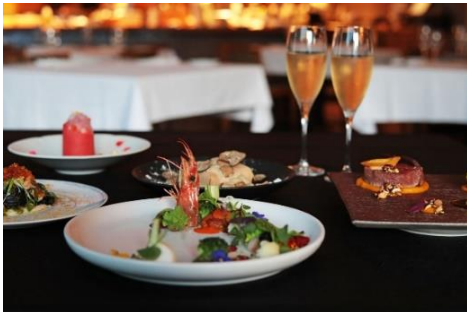
クリスマスコース(全5品)9,800円 (税サ込・テーブルチャージ別) 提供期間：12月20日(日)～25日(金) 提供時間：18:00～20:30(L.O.)

乾杯酒のスパークリングワインに合わせるカラフルな魚介の冷前菜。温前菜はホロホロ鶏とリコッタチーズの温かい栗粉クレープ包み。ズワイガニと九条ネギのラグーソースを絡めたイカスミの Pasta は聖護院蕪のピュレとともに。メインは黒毛和牛フィレのロースト、デザートはクリスマスキャンドルをモチーフにした薔薇とローズヒップの泡がアクセントのカルダモンのジェラート。