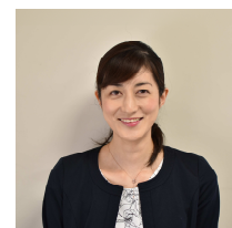
中央公会堂 守田副館長