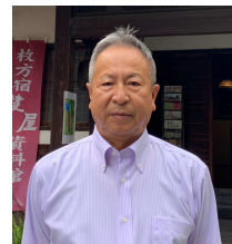
鍵屋資料館 辻他館長