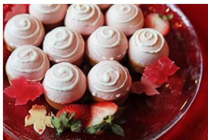
苺のヨーヨームース