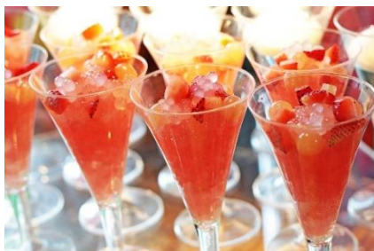
苺とタピオカのクラッシュゼリー