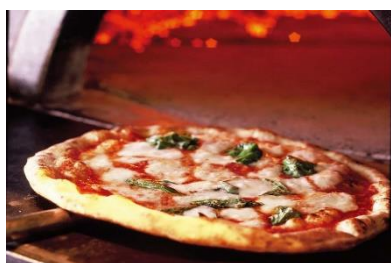
本格ナポリピッツァ