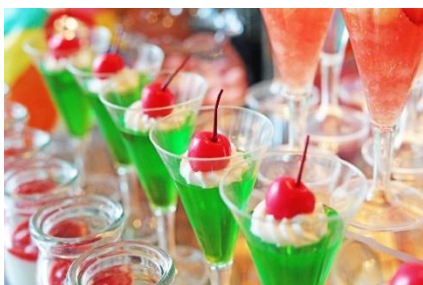
メロンソーダゼリー