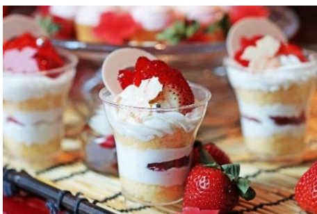
苺のショートケーキ