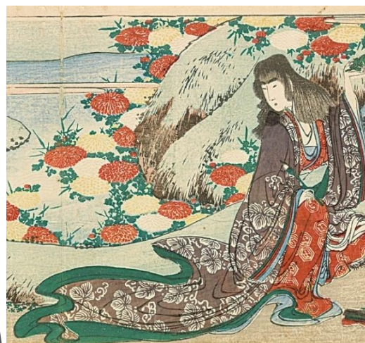
▲葛飾北斎「菊慈童」(前期)