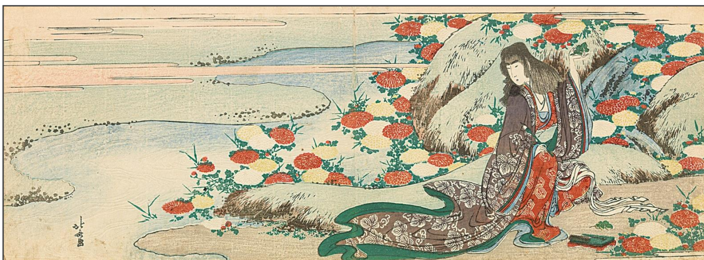
葛飾北斎「菊慈童」(前期)