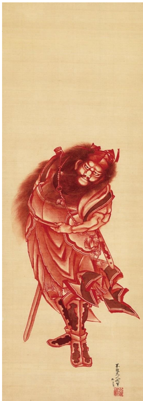
▲葛飾北斎「朱描鍾馗図」(後期)