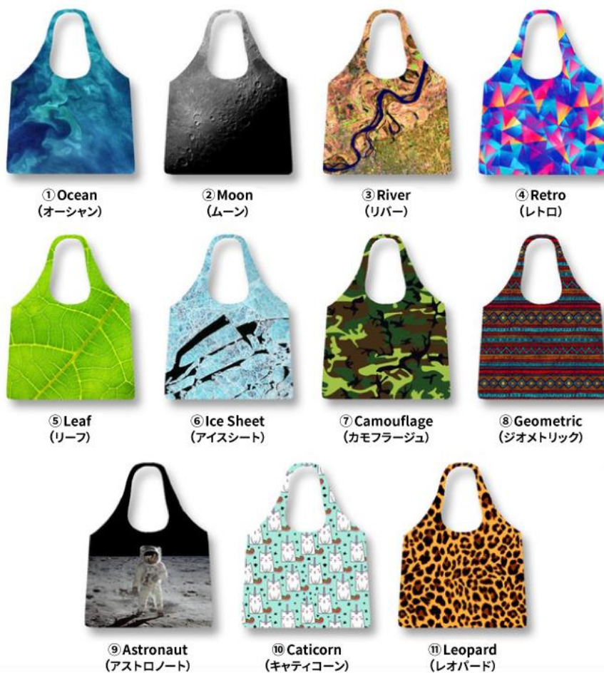
「NANONAG」オリジナルデザイン 11 柄

エコバッグ「NANOBAG」は、2017 年夏にイギリスのメーカー・tiptopthings 社がクラウドファンディングで開始した商品で、5 万枚以上の販売実績を誇るエコバッグです。2019 年初頭にエートレードが国内における総代理店となり、同年、国内クラウドファンディングで 3 月より販売開始、9 月よりロフトや