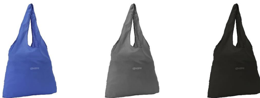
「NANOBAG」基本 3 色（ブルー、グレー、ブラック）

カラー：11 柄（オーシャン、ムーン、リバー、レトロ、リーフ、アイスシート、カモフラージュ、ジオメトリック、アストロノート、キャティコーン、レオパード）、基本 3 色（ブラック、グレー、ブルー）