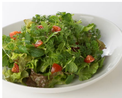
「デトックスハーブサラダ」 650円 野菜不足な方にもお召し上がりいただきたい、ミントが 爽やかに香るハーブたっぷりの特製リフレッシュサラダ。