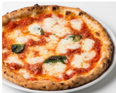
「マルゲリータ」Mサイズ 1,780円 オリジナルブレンドのトマトソースにミルクィなモッツアレラ チーズ、バジルの香りがアクセントのサルヴァトーレ 人気No.1ピッツァです。