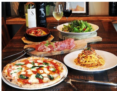
ご家庭で気軽に外食気分を味わってみてはいかがでしょうか。