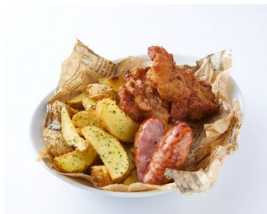
「フリットミスト」 800円 人気のイタリアンチキン、パンチェッタソーセージ、 皮付きフライドポテトを盛り合わせに。