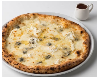
「4種のチーズのピッツァ 〜イタリア産BIOのハチミツ付き〜」Mサイズ 2,080円 ゴルゴンゾーラ、エダム、サムソー、モッツアレラの4種 類チーズのピッツァ。別添えのハチミツの甘さがチーズの 旨みと塩気を引き立たせます。