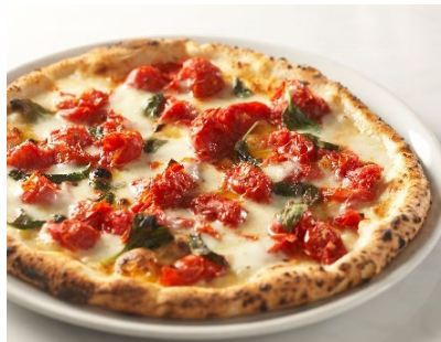
「D.O.C〜ドック〜」Mサイズ 2,320円 世界No.1受賞ピッツァ。チェリートマト、モッツアレラ チーズ、バジルのシンプルかつ贅沢なピッツァです。