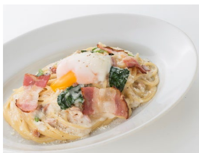
「炙りベーコンのスパゲッティカルボナーラ」 1,380円 炙りベーコンを使った特製カルボナーラ。濃厚なソースが スパゲッティにからみ、ボリュームがある一品です。