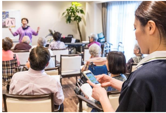
センサー・コール・記録がスマホ1台に集約