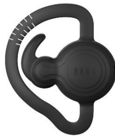
BONX Grip: スマホと Bluetooth で接続

「EGAO link」が業界でICT/IoTのスタンダードのひとつとして評価されていますが、より進化させてまいります。これからも、アズパートナーズの取り組みにご期待ください。