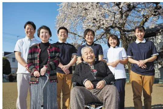
「夢を叶えるプロジェクト」