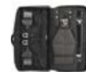
ファンクショナル トレーニングキット