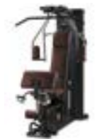
ブラックフレーム×ボルドーシート

SIZE: L184×W120×H207(cm) 重量: 240kg カラー: フレーム(ブラック、シルバー)、 シート(ブラック、ボルド)を組み 合わせてお選びいただけます。 ウェイトスタック: 5kg~90kg