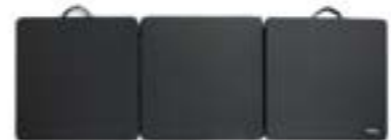
パーソナルマット 折り畳んだ状態:65×65(cm) 三枚広げた状態:65×197(cm)