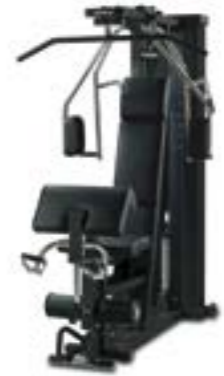
ブラックフレーム×ブラックシート