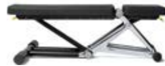
ベンチパーソナル L132×W58×H44 (cm) 47kg (本体のみ) 座面角度: 0°, 15°, 30° 背面角度: 0°, 15°, 30°, 45°, 60°, 75°, 85°

強靭さをスタイルで表現したストレングスマシン。 プロ向けの性能と独創的なスタイルを組み合わせた 筋力トレーニングのための新しいデザインソリューションです。