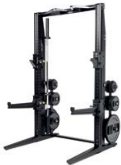
ラックパーソナル L131×W200×H222(cm) ※バーベル設置時 185kg