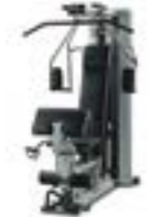
シルバーフレーム×ブラックシート