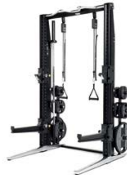
ラックパーソナル L131×W200×H222(cm) ※バーベル設置時 185kg