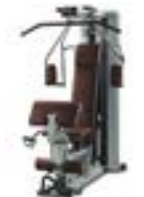
シルバーフレーム×ボルドーシート