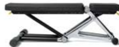
ベンチパーソナル L132×W58×H44(cm) 47kg(本体のみ) 座面角度:0°,15°,30° 背面角度:0°,15°,30°,45°,60°,75°,85°