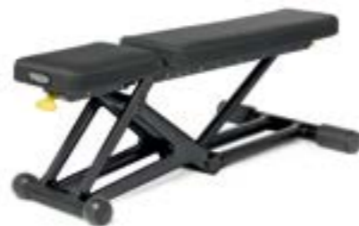
ベンチパーソナル L132×W58×H44(cm) 47kg(本体のみ) 座面角度:0°,15°,30° 背面角度:0°,15°,30°,45°,60°,75°,85°