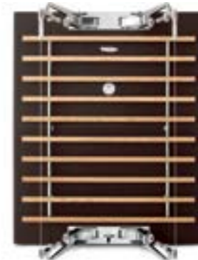
Heritage Leather (牛革) Dark Brown