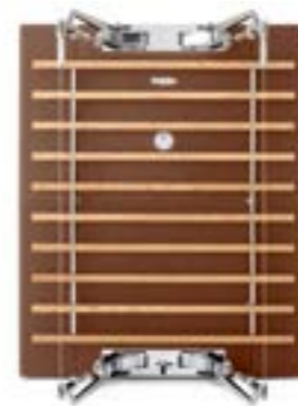
Heritage Leather (牛革) Gold Brown