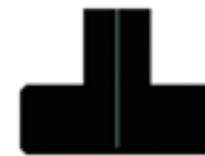
ラバーフローリング 306×229(cm)