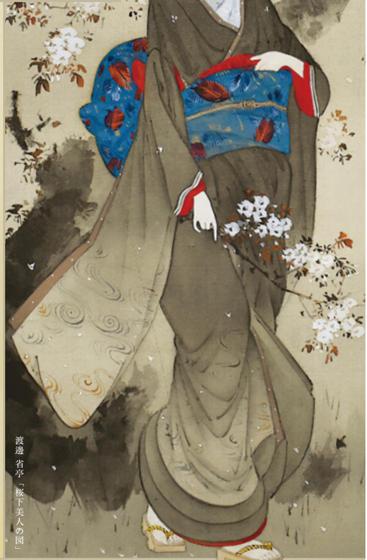
渡邊 省亭「桜下美人の図」