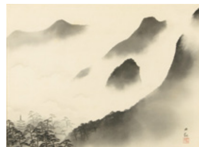
横山 大観「雨霽」 ¥3,800,000

「美祭 撰」では、室町時代から現代まで、多くの日本美術の作品をご紹介します。出品される作品はどれも加島美術が自信を持ってお送りする優品ですが、中でも今回の注目の作品は円山應挙「雲龍図」、伊藤若冲「伏見人形図」、石川孟高「犀図」、加山又造「昆虫」。その他にも、長澤蘆雪、曾我蕭白などの近世絵画、一休宗純、大愚良寛などの筆跡、横山大観などの近代絵画といった珠玉の作品を取り揃えております。