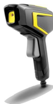
回転ウォータージェット「WBS 3」

総務省統計局が実施した「社会生活基本調査」（平成28年）によると、65歳以上の男女ともに約40%の方が趣味として「園芸・庭いじり・ガーデニング」を挙げています。また、昨今のブームによって、家庭菜園やアウトドアライフを気軽に楽しむ若者やヤングファミリー層も増えてきています。こうしたアウトドア・アクティビティを楽しむ人たちに最適な散水ノズルが、「回転ウォータージェット WBS 3」です。