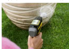
植木鉢やガーデン用品 の洗浄