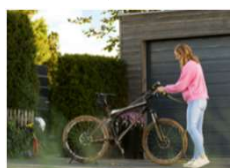
自転車・車の洗浄