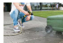
家まわりの簡単なお掃除