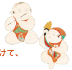
神坂 雪佳 「伊豆倉人形」より

加島美術は、2020年3月20日(金・祝)～2020年3月29日(日)にかけて、 「琳派展 —ひきつがれる装飾と簡素の美—」を開催いたします。 作品点数約25点。観覧無料。