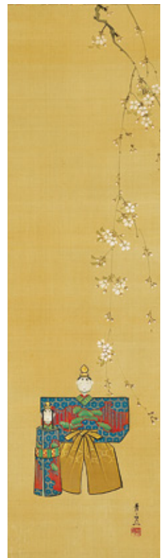
鈴木 其一 「立雛図」 絹本着色 酒井抱一祝箱 皇孫照宮成子内親王殿下御生記念

類まれな構図の感覚や、洗練された少ない手数でモチーフを表現するのはまさに琳派絵師たちの得意とするところ。金銀砂子を多くあしらった華やかな作品の影に埋もれがちですが、彼らの実力は、素材がシンプルな水墨画にこそ宿ります。今回は普段埋もれがちな水墨作品もご覧いただけます。尾形乾山による「桜図」は優しい筆致で描かれた墨の濃淡と、花卉の仄かな彩色が高尚な奥床しさを湛えます。また昨年末に京都の細見美術館で企画展が催された中村芳中による「托鉢図」など、観る者が顔をほころばせってしまうような可愛らしさがある作品も…。華やかなだけではない洗練された画技と構図感覚が光る琳派の側面をどうぞお楽しみください。