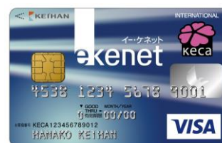
e-kenet VISA カード 券面