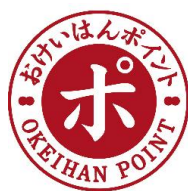
おけいはんポイントロゴ