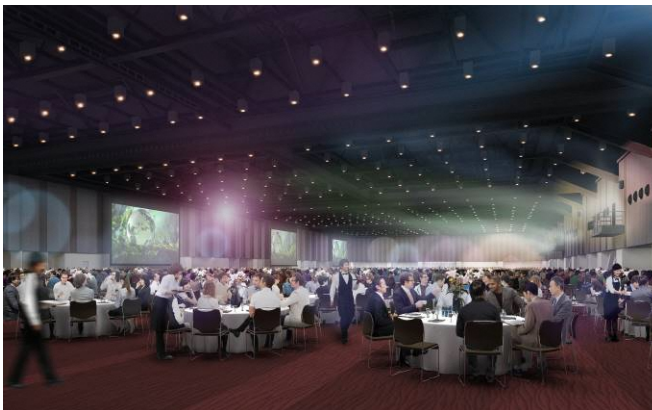
国内最大規模の多目的ホール