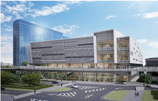
国際大通りから見たパシフィコ横浜ノース(手前)