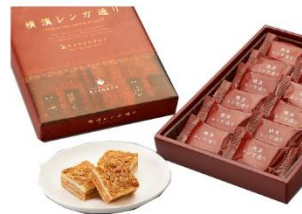
新横浜駅 株式会社ウイッシュボン 横濱レンガ通り