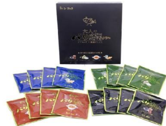
静岡駅 シーラック株式会社 大人のバリ勝男くん。