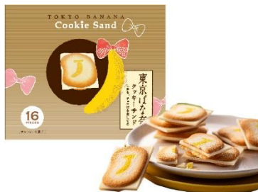
東京駅 株式会社グレープストーン 東京ばな奈クッキーサンド しかも、チョコはみ出してる