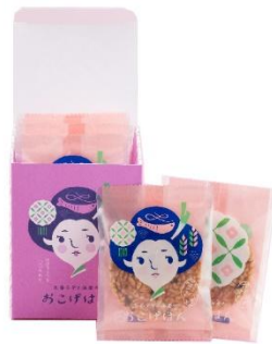
京都駅 株式会社イチハナダッテ 九条ネギと海老のおこげはん