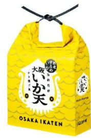
新大阪駅 株式会社坂角総本舗 大阪いか天