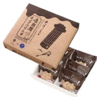
名古屋駅 名古屋フランス corp株式会社 名古屋チョコふらんす