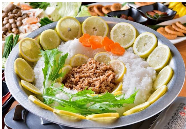
オリジナルの「ひまわり鍋」