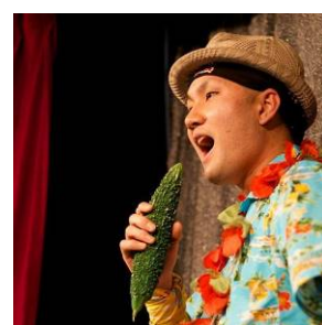
デビッドちんすこう