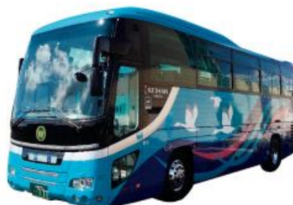
▲江若交通の貸切バス