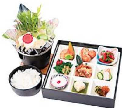
▲お山の精進料理が楽しめる「山の御膳」