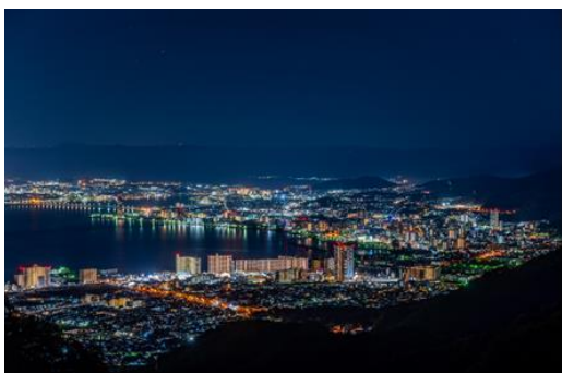
▲比叡山から望む夜景