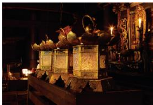
▲比叡山延暦寺の根本中堂(国宝)