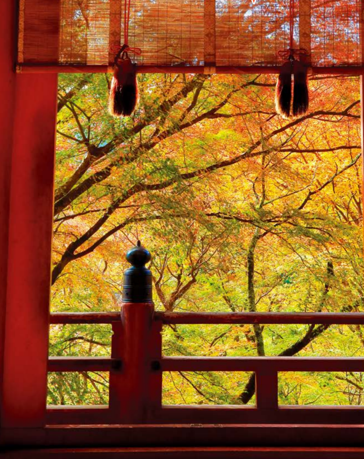
麗しき大和路の秋