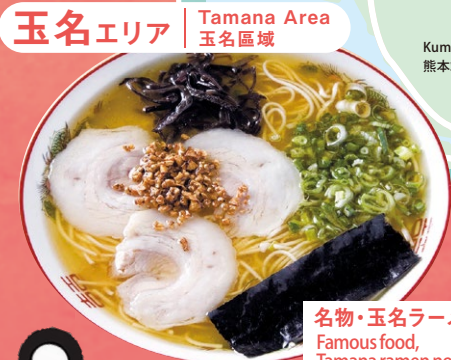
名物・玉名ラーメン Famous food, Tamana ramen noodles 名物・玉名拉麵