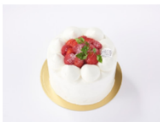
ショートケーキ 12cmホール 2,959円(税込)