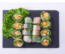
生春巻きオードブル 1,500円(税込)