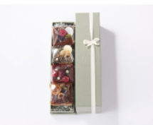
キャトルカール 4個入 2,278円(税込)