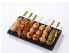
焼鳥盛合せ タレ 7本入 1,080円(税込)