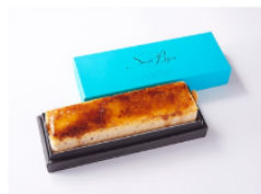
トロニア・セミフレッドケーキ 1,620円(税込)