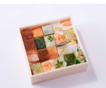
詰合せ 浪花寿司 843円(税込)