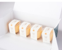
御養卵のカスタードプリン 1,339円(税込)