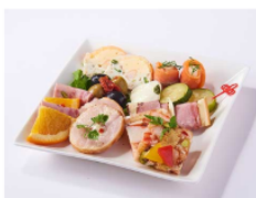
ワインにおすすめ前菜盛合せ 1,296円(税込)