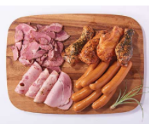
おつまみパーティーセット 1,620円(税込)