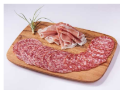
イタリア3種パック 1,080円(税込)