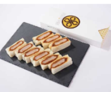
ヒレかつサンド 9切入 1,264円(税込)