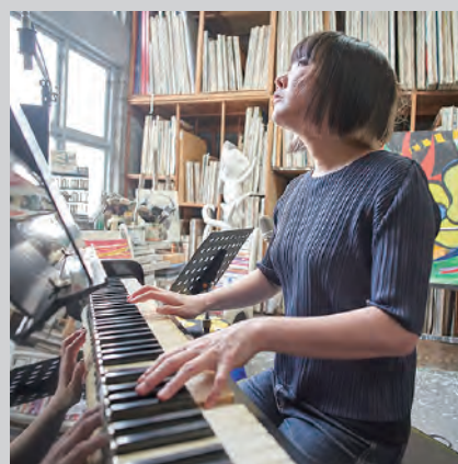
片倉 真由子 (かたくらまゆこ)

1950年生まれ。 1970年に上京するとすぐに頭角を現し、1975年に初リーダーアルバム『TOKI』を発表。以来、トッププレイヤーとしてジャズ界を牽引しつづけている。自身のバンド活動はもとより、1985年からは山岸潤史とともに〈チキンシャック〉を結成するなど、フュージョンシーンでも活躍。他ジャンルのアーティストにも惜しみなく力を貸し、なかでも30年におよんだ山下達郎バンドでの名演は今も語り草になっている。2018年に〈Days of Delight〉より最新作『Black Eyes』をリリース。