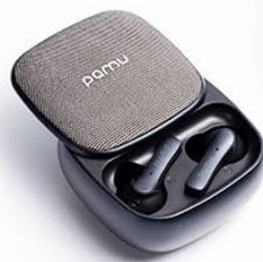
MIDNIGHT BLACK ミッドナイトブラック