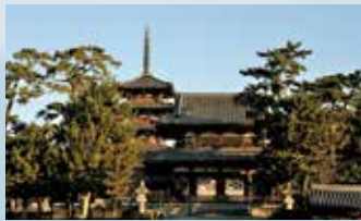
The area around the "Buddhist Monuments in the Horyuji Area"