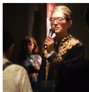
スペシャルツアー (2018 年の実施風景)