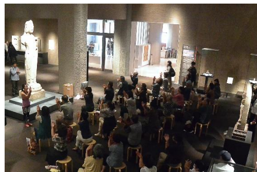
気軽に椅子ヨガ in 東洋館（2018年の実施風景）