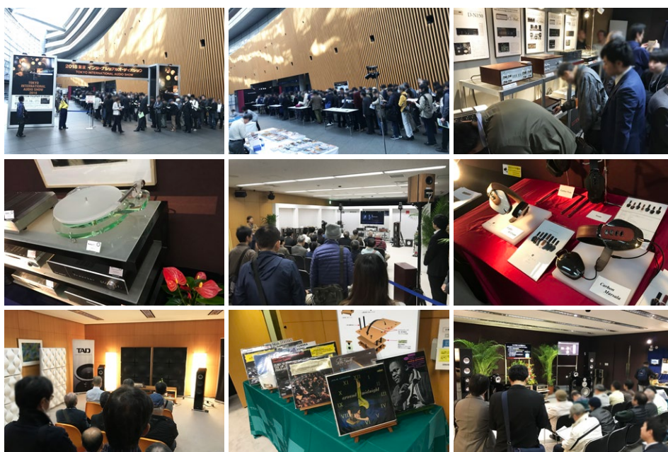
2018 東京インターナショナルオーディオショーの様子

※当日の会場は大変な混雑が予想されます。ご要望に添えない場合もございますので、予めご了承ください。