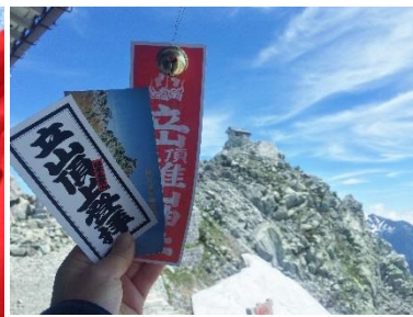
参拝記念にもらえる鈴旗