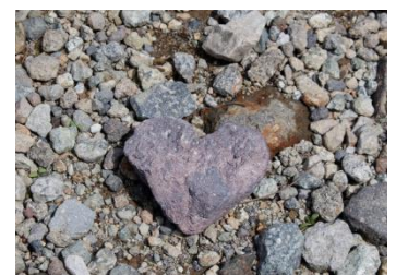
雄山山頂に続く登山道には、 ハート形の石が・・・

【URL】立山山頂ウォーク https://www.alpen-route.com/_wp/event/4762