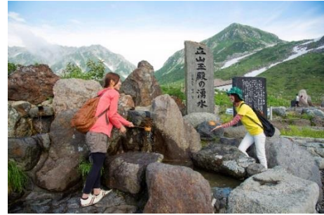
水温は年間を通して、夏でも 2～5℃。採水自由