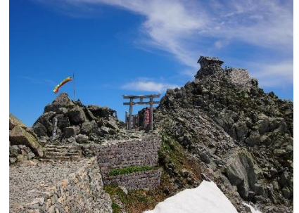
標高 3,003m 雄山山頂、 天空の社「雄山神社峰本社」

【雄山神社峰本社】7月1日～9月30日 期間開設され、山岳信仰の聖地でのお祓いとお神酒をいただく参拝は、神秘的で貴重な体験になるはず。