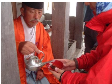
神主さまからお神酒をいただく