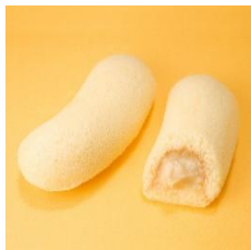
〈東京駅〉 東京ばな奈「見つけたっ」