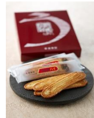
〈静岡駅〉 うなぎパイ