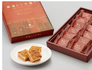
〈新横浜駅〉 横濱レンガ通り