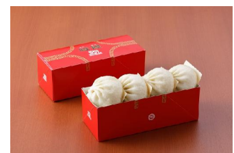
〈新大阪駅〉 豚まん(4個入)