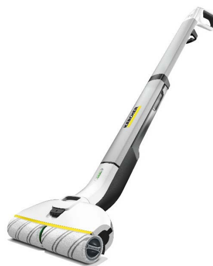
フロアクリーナー「FC 3d」