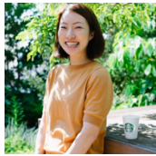
普川 玲 スターバックス コーヒージャパン