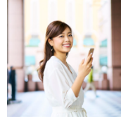
石山 アンジュ 内閣官房シェアリング エコノミー伝道師