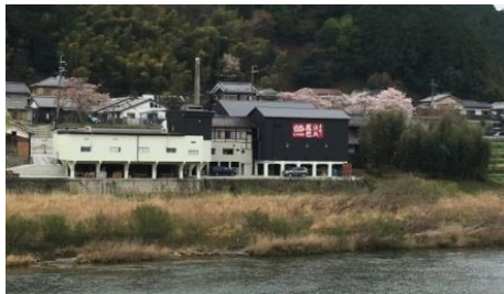
【美吉野醸造(株)の蔵】