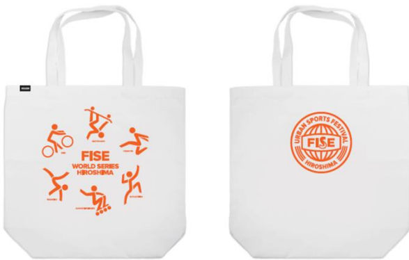
TOTE WHITE 2,000 円(税抜)