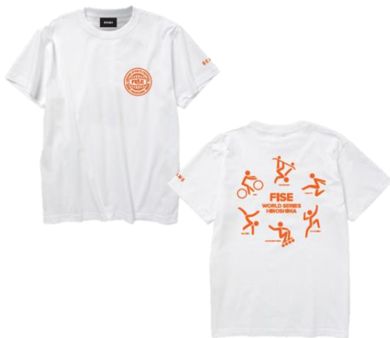
SHORT SLEEVE TEE WHITE 4,000 円 (税抜)

一般社団法人 日本アーバンスポーツ支援協議会 (Japan Urban Sports Support Committee) は 4 月 19 日 (金)、20 日 (土)、21 日 (日) に広島県にある旧広島市民球場跡地で開催いたします『FISE HIROSHIMA 2019』と輸入及びオリジナルの衣料品や雑貨を販売する大手セレクトショップ『BEAMS』がコラボレーションした大会公式アイテムを限定で発売いたします。