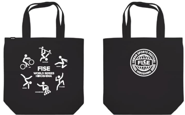
TOTE BLACK 2,000 円(税抜)