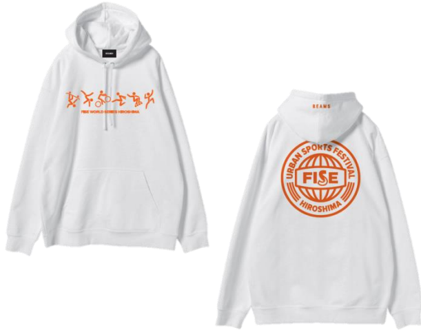
HOODIE WHITE 7,500 円(税抜)