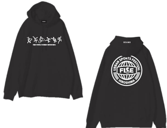
HOODIE BLACK 7,500 円 (税抜)

『FISE HIROSHIMA』がアパレルブランドとのコラボレーションするのは初めての試みとなり、FISE エンブレムが BEAMS のコーポレートカラーのオレンジでデザインされた T シャツや、ロングスリーブ T シャツ、フーディ、トートバックなど全 4 種類、計 8 アイテムを展開します。