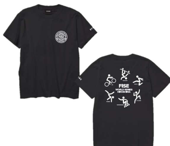
SHORT SLEEVE TEE BLACK 4,000 円(税抜)