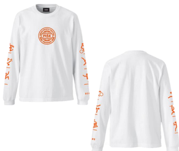
LONG SLEEVE TEE WHITE 5,000 円(税抜)