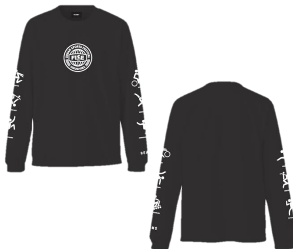
LONG SLEEVE TEE BLACK 5,000 円(税抜)