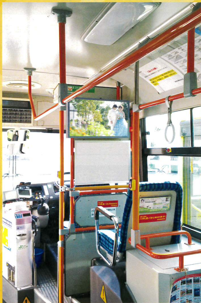
※画像ははめ込みです。