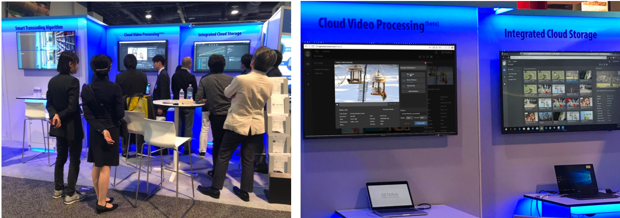
「NAB Show 2018」出展時の様子