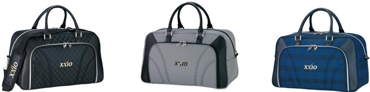
スポーツバッグ GGB-X105 12,000円+税 ※3

素材：ポリエステル×合成皮革(P.U.) サイズ：L47×H28×W23(cm) 重さ：約1.0kg カラー：ブラックチェック、チドリ、ネイビーチェック MADE IN CHINA