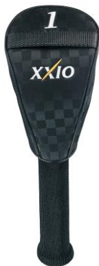
ヘッドカバー(ドライバー用) (460cm 3 対応) GGE-X105D 3,000円+税 ※3

素材：ポリエステル×合成皮革(P.U.) サイズ：L47×H28×W23(cm) 重さ：約1.0kg カラー：ブラックチェック、チドリ、ネイビーチェック MADE IN CHINA