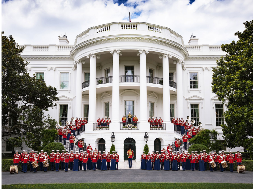
アメリカ海兵隊バンド