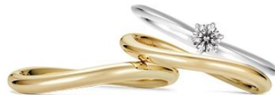
画像左 婚約指輪：ハピネスクラウンⅡ（プラチナ950）、結婚指輪：コメットⅡ（プラチナ950） 200,000円 画像右 婚約指輪：ハピネスクラウンⅡ（プラチナ950）、結婚指輪：コメットⅡ（K18イエローゴールド） 190,000円