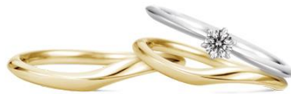
画像左 婚約指輪：ハピネスクラウンⅡ（プラチナ950）、結婚指輪：アリエッタⅡ（プラチナ950） 200,000円 画像右 婚約指輪：ハピネスクラウンⅡ（プラチナ950）、結婚指輪：アリエッタⅡ（K18イエローゴールド） 190,000円