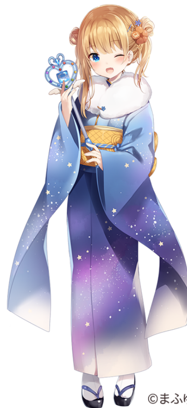
左：期間限定カラー「初号機」の画面イメージ、右：魔法少女★駅すぱあと（©まふゆ）

本キャンペーンは、“「駅すぱあと」が冬コミに参加するみんなを応援するために魔法少女になった”というストーリーで展開する「駅すぱあと」アプリのプロモーションキャンペーンです。各種コンテンツとともに、「駅すぱあと」を擬人化した「魔法少女★駅すぱあと」のオリジナルイラストを公開します。