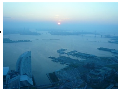
スカイガーデンからの初日の出の様子