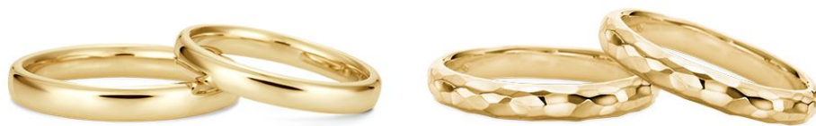
ストレートライン（平甲丸） ・ ストレートライン（槌目模様）