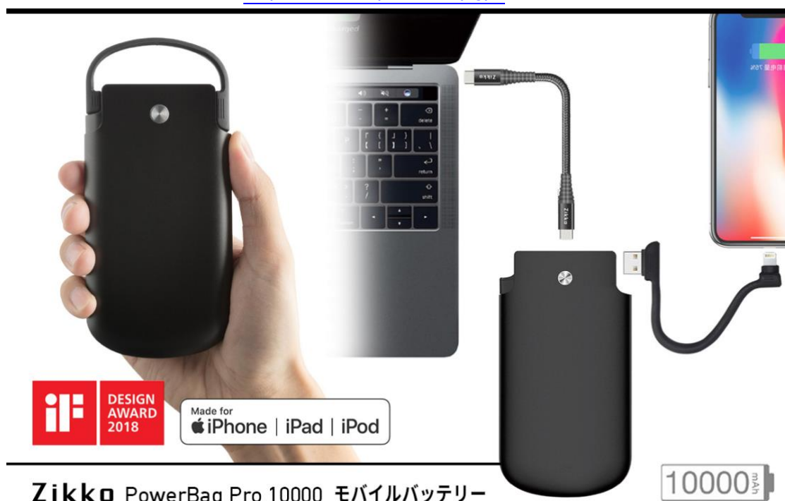
Zikko PowerBag Pro 10000 モバイルバッテリー

オフィシャルオンラインショップ ( http://www.mycaseshop.jp/ ) にて販売中です。