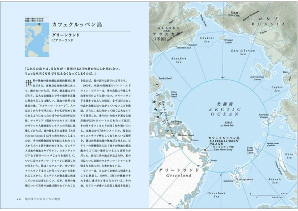
118 地の果てのありえない物語