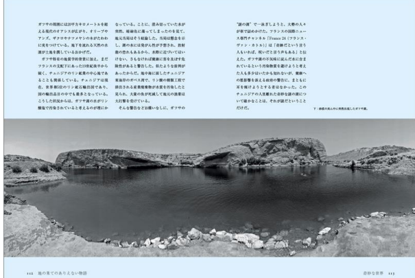
112 地の果てのありえない物語