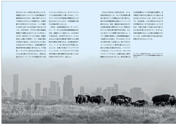
119 地の果てのありえない物語

【報道関係からの問合せ先】 日経ナショナル ジオグラフィック社 広報事務局 株式会社リリオ 担当：仁地（にんち） TEL：03-6438-9195 090-2226-6459 ninchi.mikito@lirio.biz 日経ナショナル ジオグラフィック社 〒105-8308 東京都港区虎ノ門4-3-12