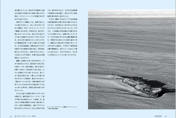
14 地の果てのありえない物語