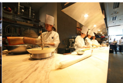
パティシエチーム