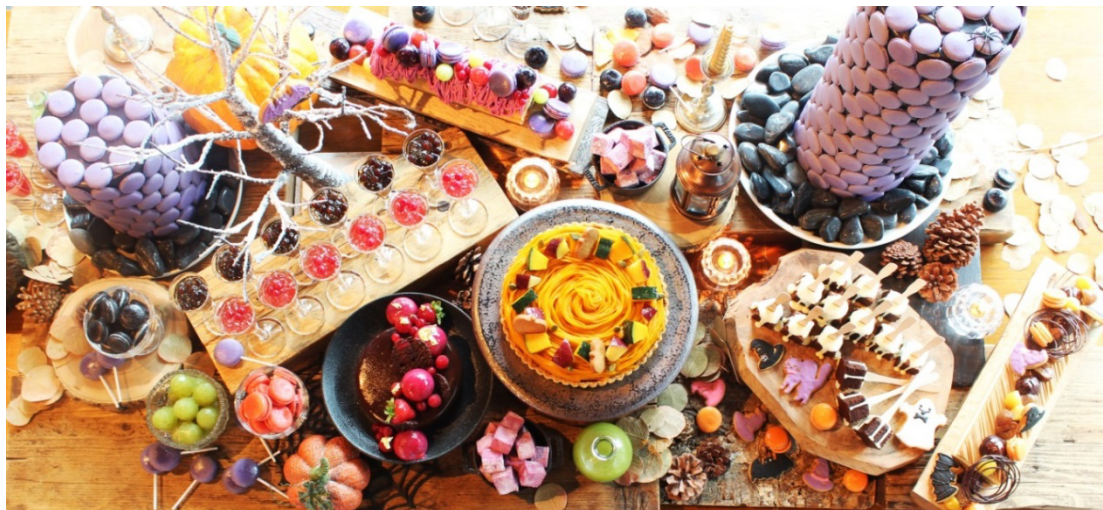
Sweet Halloween 2018イメージ

第2弾は、この時期欠かせないハロウィンをテーマに！ ハロウィンならではの妖艶な色づかいのデザートの数々で、おもわず「Trick or treat!」と聞こえてきそうな世界へご案内。 常時15種類、愉快的デザートも豊富にご用意しております。